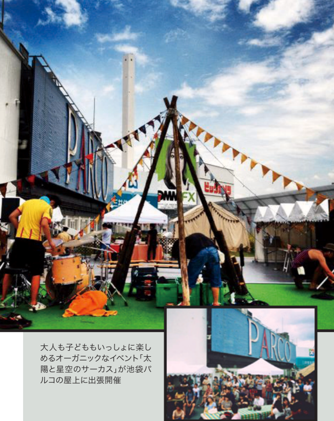
大人も子どももいっしょに楽しめるオーガニックイベント「太陽と星空のサーカス」が池袋パルコの屋上に出張開催